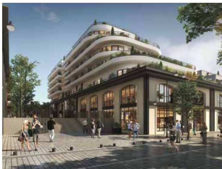
498 logements / 2 073 m 2 de bureaux / 13 410 m 2 de commerces / hôtel de 80 chambres - 77 rue des Rosiers à Saint-Ouen-sur-Seine (93) - BNP Paribas Immobilier - Livraison 2023