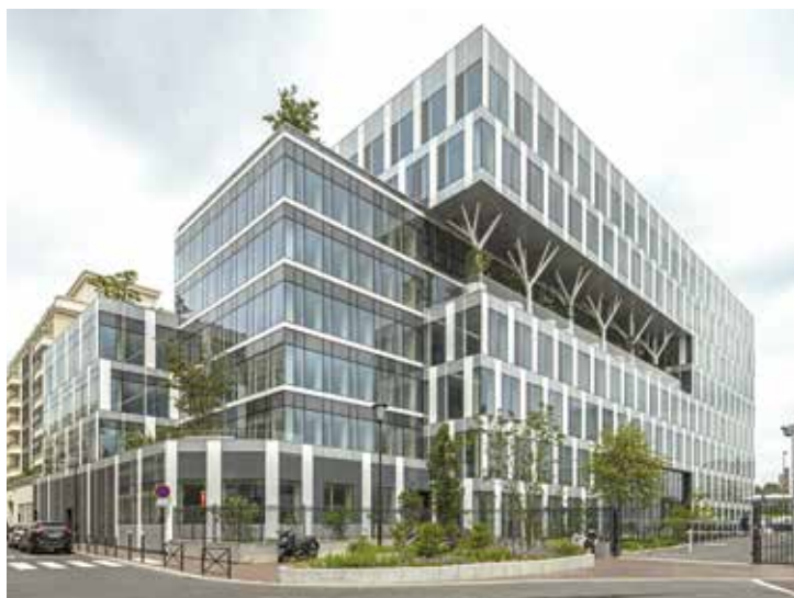
10 280 m 2 de bureaux - 7 rue Pablo Neruda à Levallois-Perret (92) - Axe Promotion - Livraison 2020