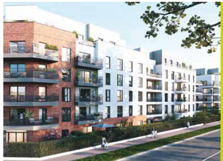
268 logements / 3 766 m 2 de bureaux / Résidence étudiants de 113 chambres / Crèche de 450 m 2 / cabinet médical de 221 m 2 - 14 Avenue des Béguines Cergy (95) - Sogeprom - Pyramides d'Argent 2021 Mixité Urbaine