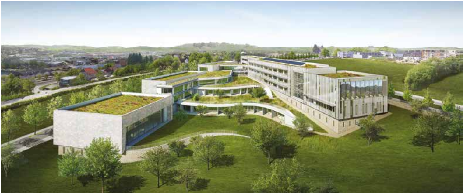
En cours de travaux - Construction de l'Institut de Formation des Professions de Santé à Besançon (25) - E3C1