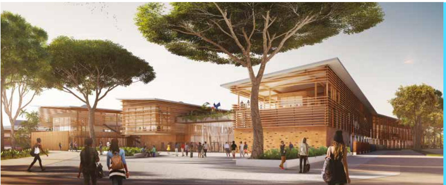
En cours de travaux - Construction du lycée polyvalent de Saint-Laurent-du-Maroni - Guyane (976) Démarche QEA Qualité Environnementale Amazonienne