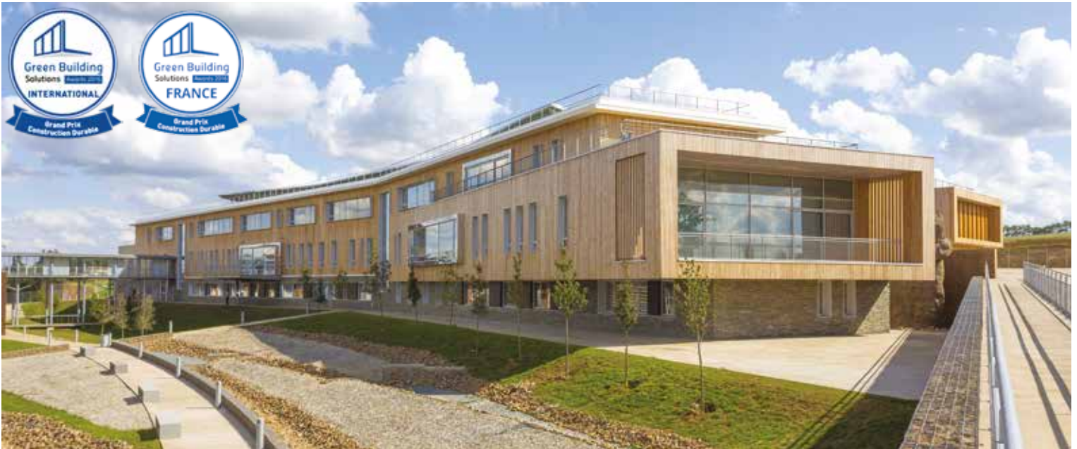
2016 - Livré - Construction du lycée Julien Gracq à Beaupréau (49) - Certifié HQE «NF Bâtiment tertiaire», labellisé BEPOS Grand Prix de la Construction Durable aux GBS (Green Buildings Solutions) Awards en 2016 à l'occasion de la COP 21